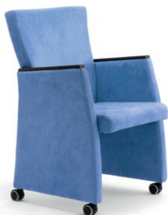
YOUNG h920 . d655 . w590