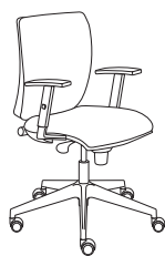
179261 h1005 . d680 . w680