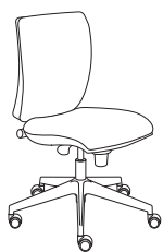
179211 h1005 . d680 . w680

Sprint steht für Schnelligkeit, Zweckmäßigkeit und leichte Handhabung. Ein echtes Spitzenmodell, das sich dank seiner Benutzerfreundlichkeit seit Jahren großer Beliebtheit erfreut. Ein Stuhl, der lässig durch den Tag begleitet und das Zurechtfinden im Arbeitsplatzdschungel erleichtert.