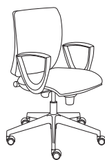
179281 h1030 . d680 . w680